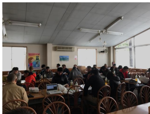
(平成 29 年 12 月 10 日 スタッフ研修会の様子)