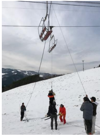
(平成 29 年 12 月 10 日 緊急救助訓練の様子)